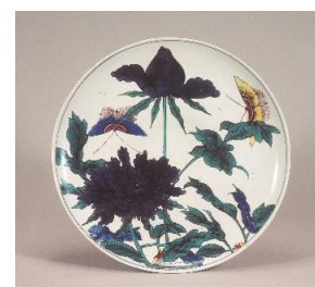
色絵 牡丹双蝶文 皿 伊万里(古九谷様式) 江戸時代(17世紀中期) 口径35.2cm

《次回展示予告》 『千変万化—革新期の古伊万里—』 2025年1月15日～3月30日